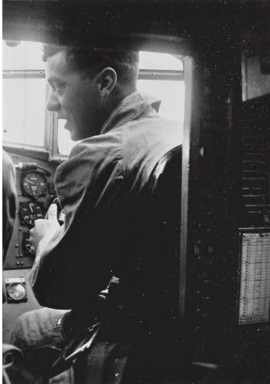
Baráti csevej a vezérállásban