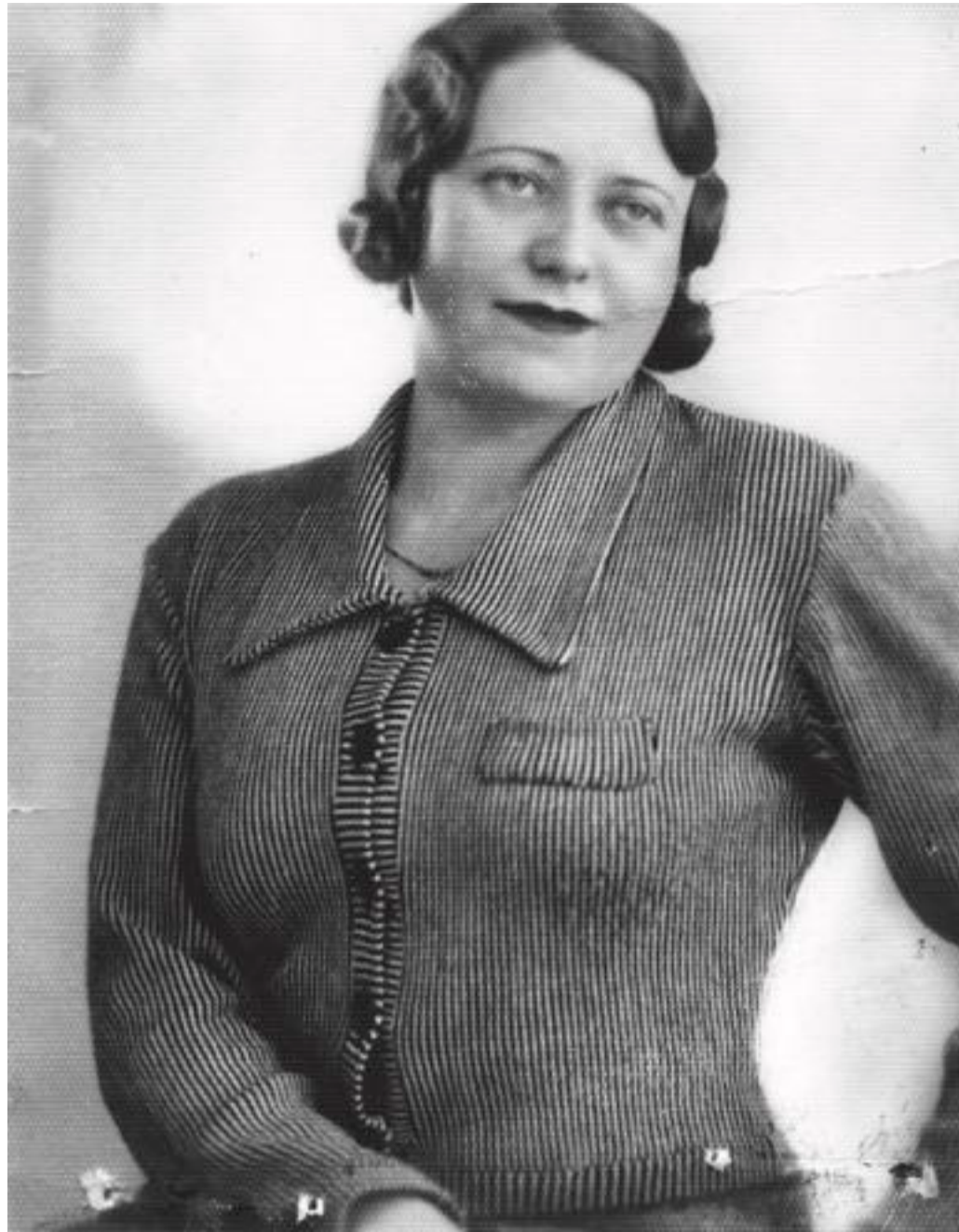
H. Olga élete igazi kelet-európai szürreál volt