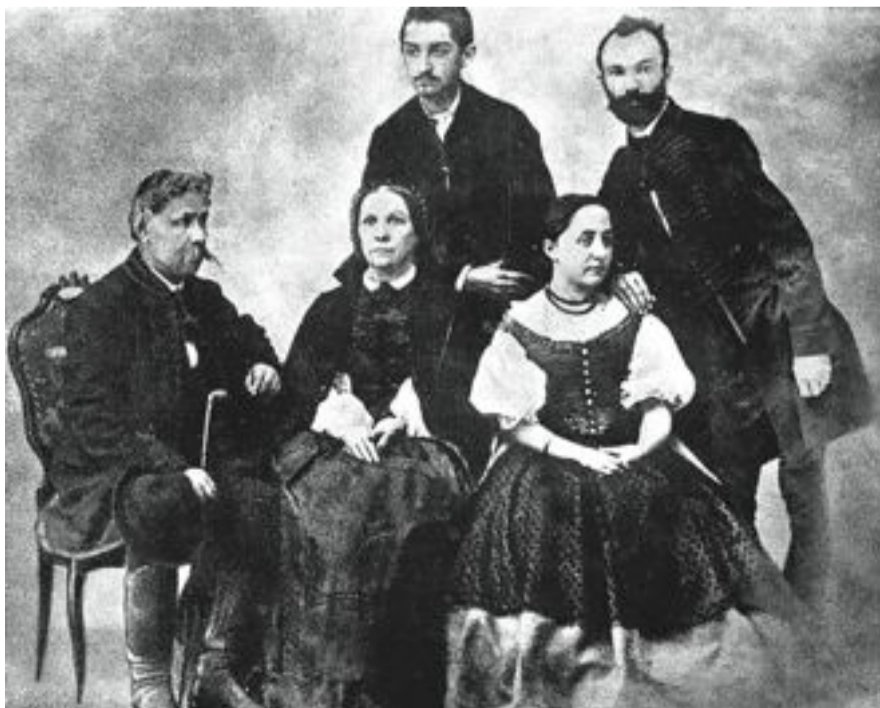
Arany János és családja: felesége, fia, lánya és leendő veje, Széll Kálmán