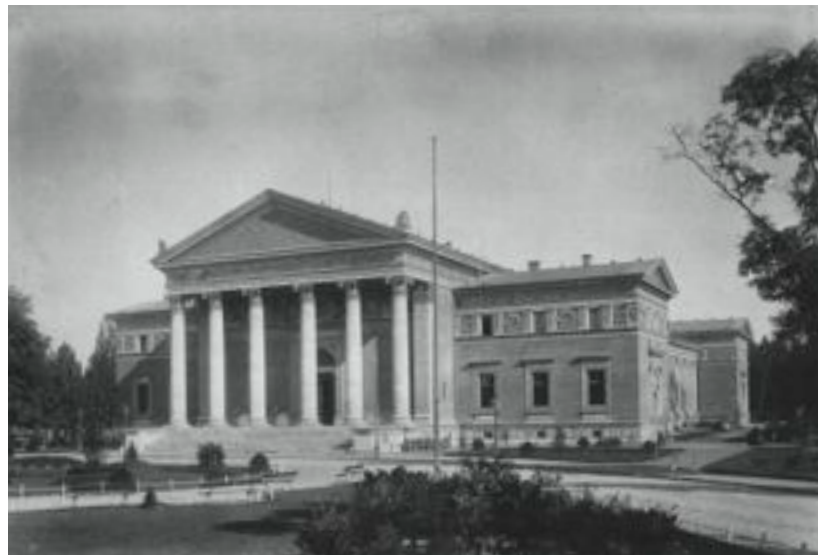
A Múcsarnok épülete Klösz György 1890 után készült felvételén