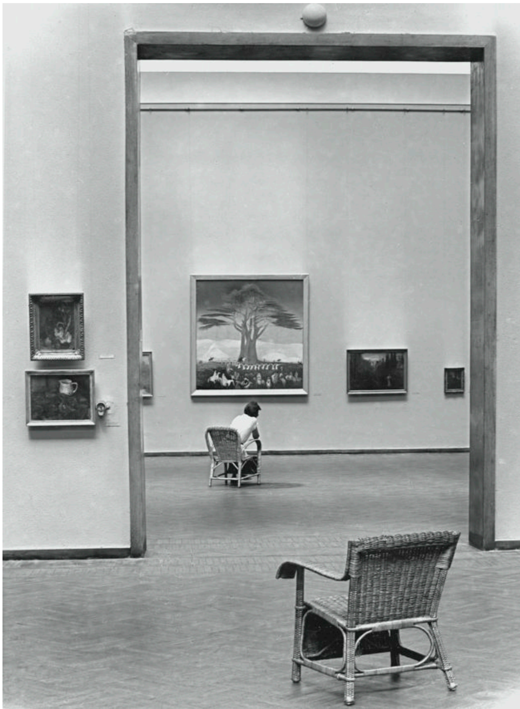
A Kertészet a magyar képzőművészetben című kiállítás a Múcsarnokban, 1956. július–szeptember