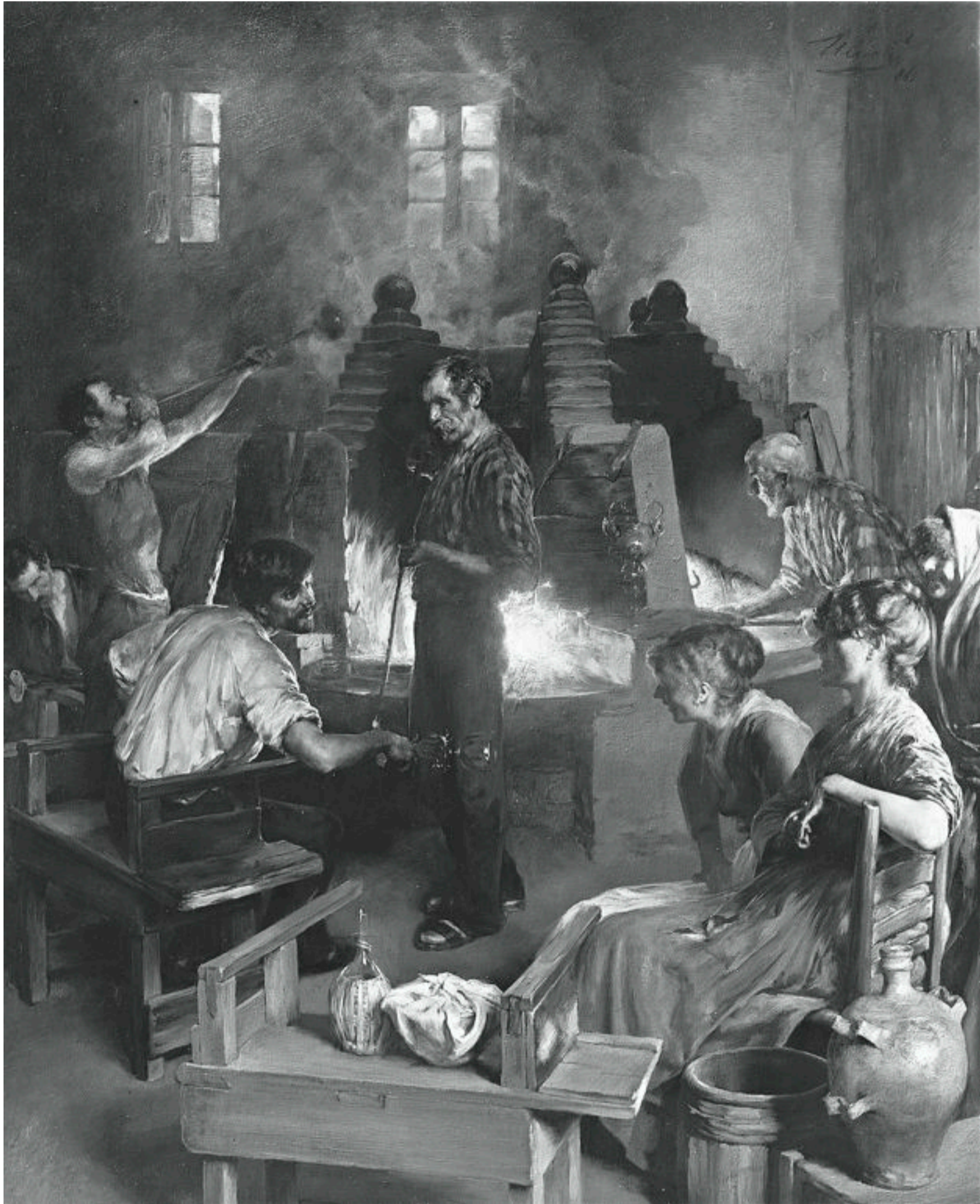
Charles Frederick Ulrich: Muránói üvegfúvók, 1886, olaj fán, 66,4×53,7 cm

Az üvegesek 1291-ben Murano szigetére költöztek át, mert a velenceiek roppant módon féltek a tűzvésztől, és tűz nélkül működő üveghutát még akkortájt sem ismertek