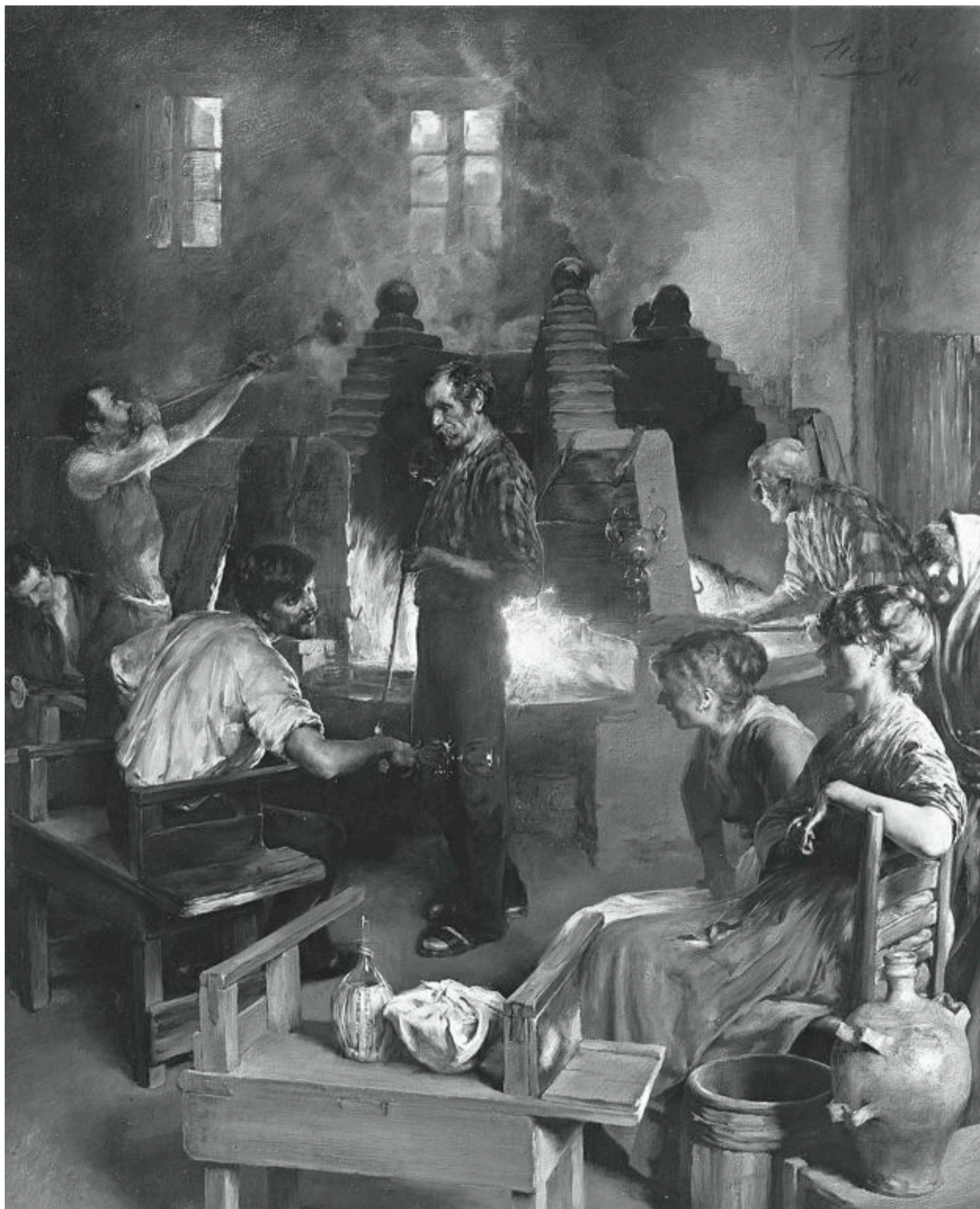
Charles Frederick Ulrich: Muránói üvegfúvók, 1886, olaj fán, 66,4×53,7 cm

Az üvegesek 1291-ben Murano szigetére költöztek át, mert a velenceiek roppant módon féltek a tűzvésztől, és tűz nélkül működő üveghutát még akkortájt sem ismertek