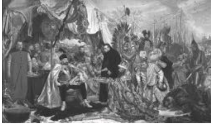
Jan Matejko: Báthory István Pszkov alatt (olaj, vászon, 322x545 cm, jelenleg a varsói királyi várban látható, Budapesten kiállítva 1872-ben és 1938-ban)