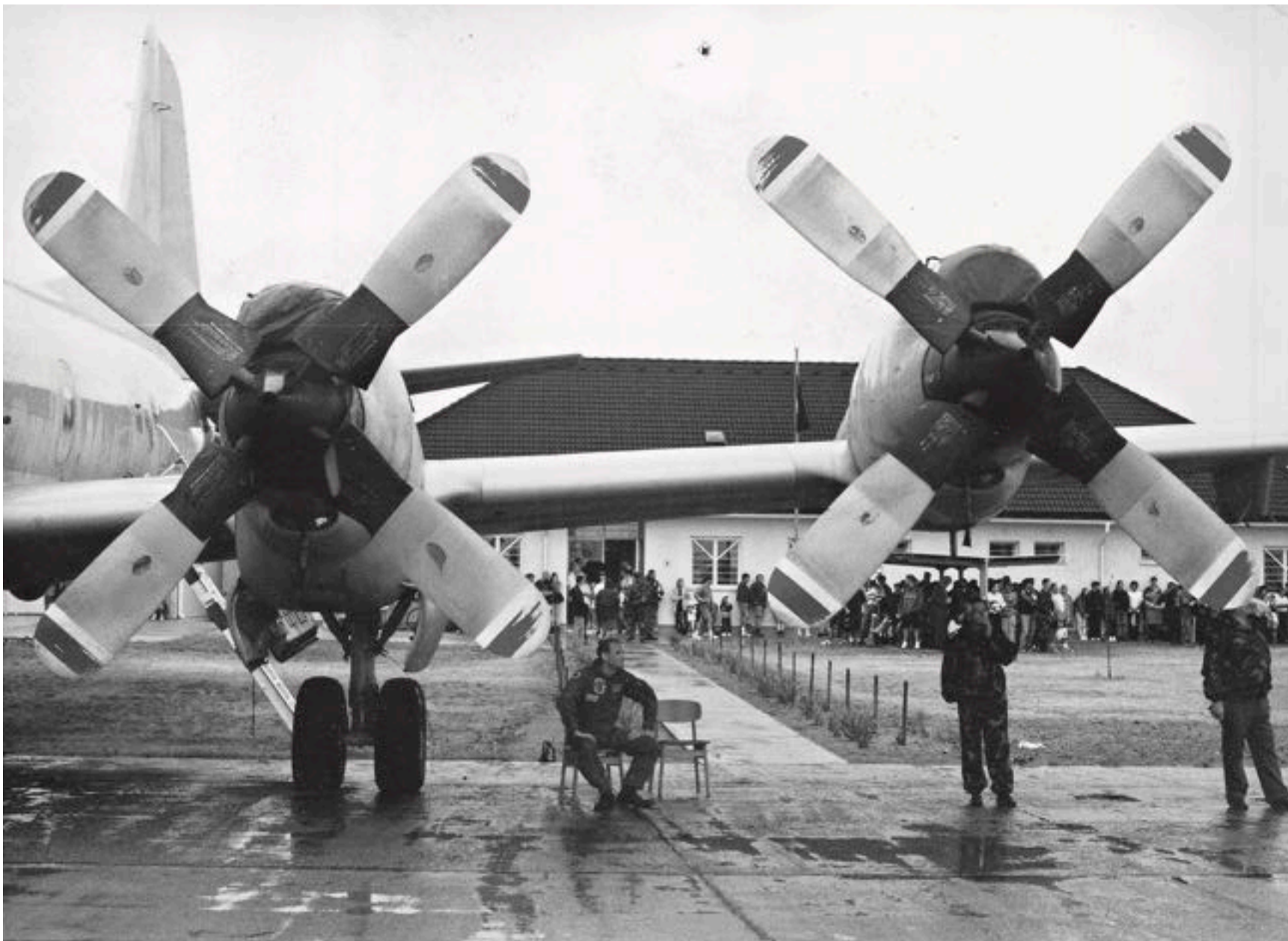
Privát esőbeálló a személyzetnek – vitathatatlanul szeles, de legalább jól lehet látni alóla a programot